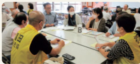
グループでの情報交換の様子

会議では福田学区の高齢者や子どもの状況を把握した上でグループに分かれて情報交換を行いました。数十年ぶりに夏祭りを開催した町内会の活動発表やあんしんカプセルを使った見守り活動の事例の発表なども行い、今後の活動の参考になる事例についても共有することができ、とても有意義な会になりました。