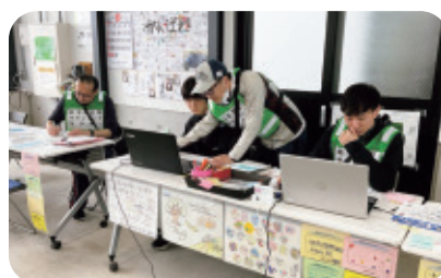
ニーズ調整の様子（能登町）