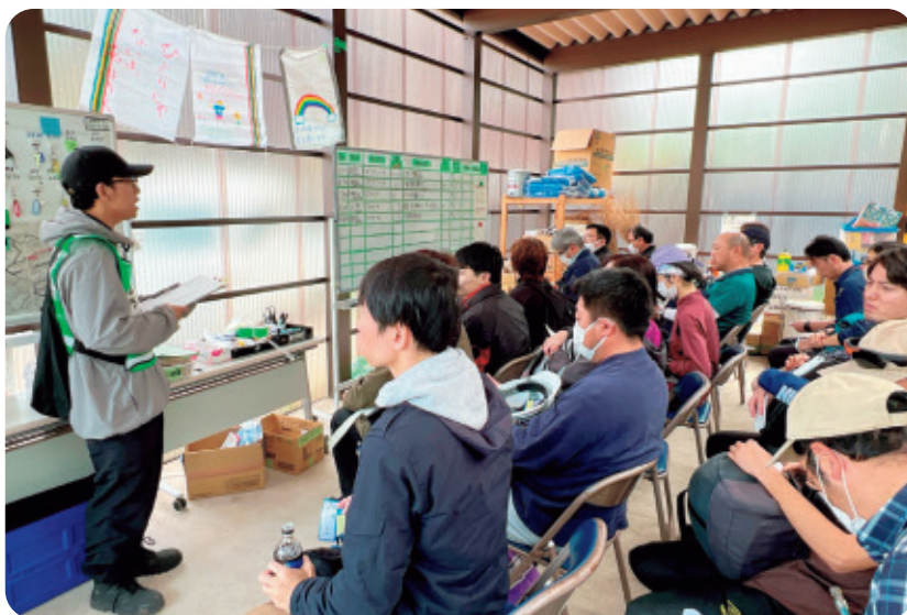
オリエンテーションの様子（能登町）

最後になりましたが、被災地の皆さんが少しでも安心して生活ができるように引き続き支援をしていきたいと思っております。