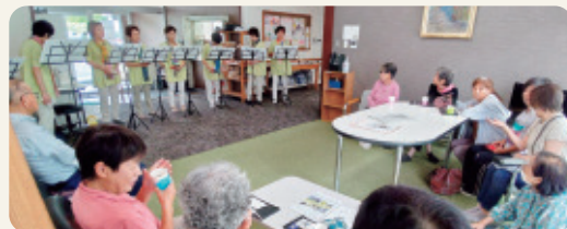
未楽来カフェ & 食堂の1コマ