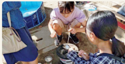
お友達とべっこう飴づくり