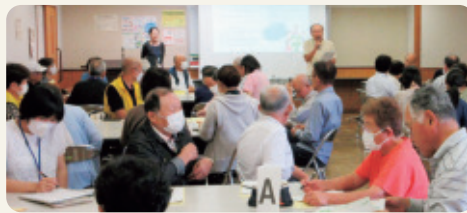
会議の振り返りの様子