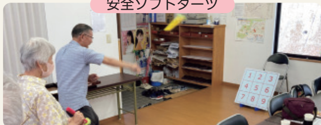
安全ソフトダーツ