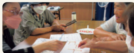
マッチ棒で脳トレ