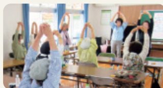
みんなでストレッチ

参加された皆さんには「みんなと会って話すことが楽しい」「今日もたくさん笑った」など、とても楽しい時間、居場所になっています。