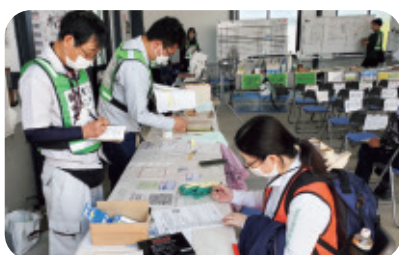
活動報告の様子（能登町）