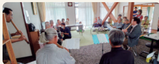
皆さん楽しく交流しています