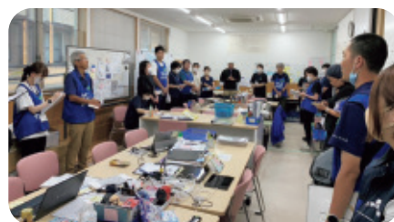
ミーティングの様子（輪島市）