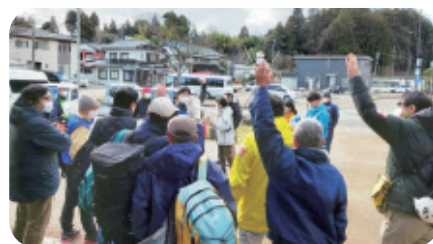
マッチングの様子（穴水町）